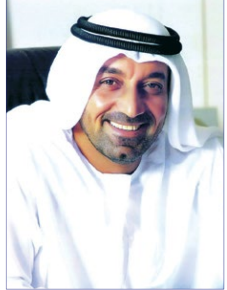
الشيخ أحمد بن سعيد.