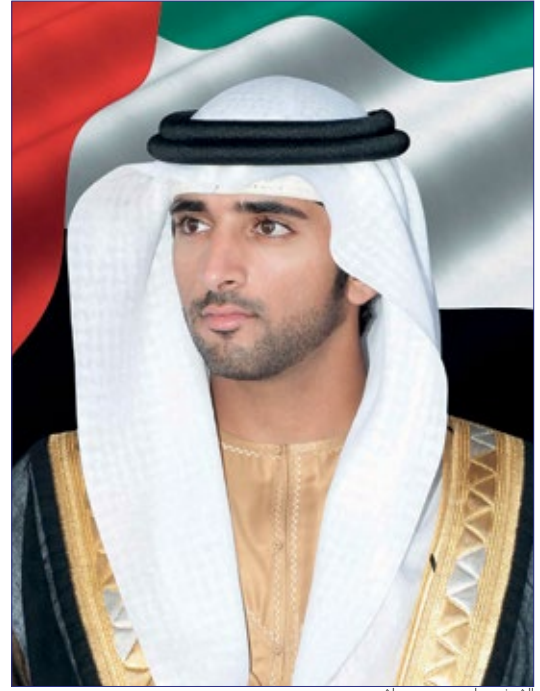
الشيخ حمدان بن محمد بن راشد.