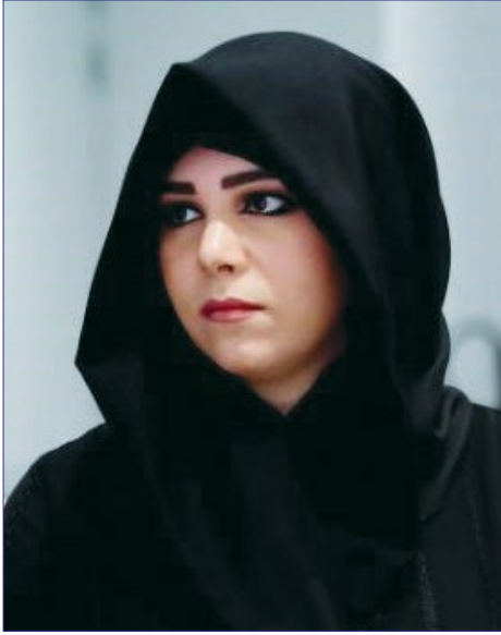
الشيخة لطيفة بنت محمد بن راشد .