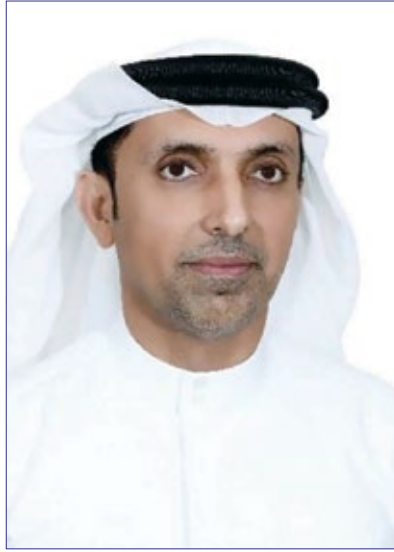
اللواء طلال بالهول.