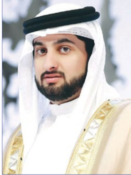
الشيخ أحمد بن محمد بن راشد