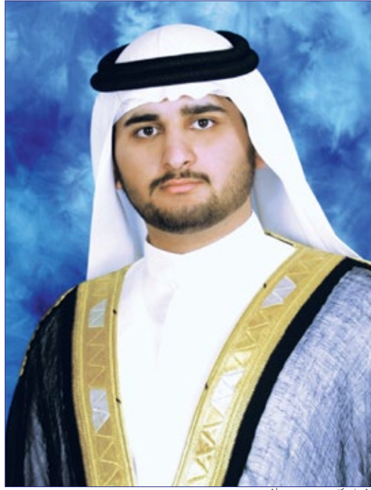
الشيخ مكتوم بن محمد بن راشد.